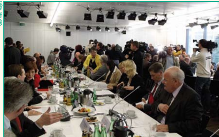
Großes Medieninteresse am Runden Tisch gegen sexualisierte Gewalt

Weiss rief zugleich Vereine und Verbände auf, unter Einbeziehung des Jugendamtes jeden Verdachtsfall zur Anzeige zu bringen und Vertrauenspersonen zu benennen, die von Opfern angesprochen werden können. Dabei müsse der Schutz des Opfers stets im