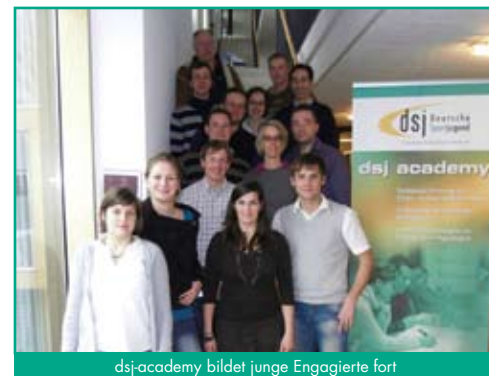
dsj academy bildet junge Engagierte fort

Die dsj academy ist ein Qualifizierungsprogramm für junge Engagierte, die ihre Kenntnisse und Fähigkeiten für ihr Engagement weiterentwickeln möchten, um sich so noch kreativer und sachkundiger in der Jugendarbeit im Sport engagieren zu können.