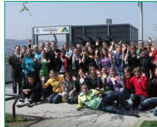
Gute Aussichten, djJ- Juniorteam vor der Jugendherberge Stuttgart

Die Aktivitäten des djJ- Juniorteam bringen interessierte junge Menschen zwischen 16 und 26 Jahren zusammen, die sich, ohne in ein „Amt“ gewählt worden zu sein, engagieren möchten. Dabei bietet ihnen das Modell Juniorteam einen niedrigschwelligem Zugang zum Engagement innerhalb der Deutschen Sportjugend.