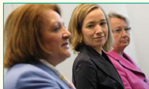
Bundesjugendministerin Kristina Schröder (Mitte) mit Sabine Leutheusser-Schnarrenberger (li) und Annette Schavan (re)

Die Deutsche Sportjugend und ihre Mitgliedsorganisationen richten ihre Aktivitäten bereits seit vielen Jahren darauf aus, Kinder und Jugendliche stark zu machen, ihnen insbesondere durch vielfältige Könnenserlebnisse das Rüstzeug mitzugeben, sich gegen Gewalt – auch sexuelle Gewalt – im privaten und öffentlichen Bereich zur Wehr zu setzen. Gezielte Initiativen sollen darüber hinaus Opfer ermutigen, sich an Vertrauenspersonen zu wenden und Beratung zu suchen. Ähnliche Projekte gibt es auch für Frauen, wie zum Beispiel das Projekt „Gewalt gegen Frauen – nicht mit uns“.