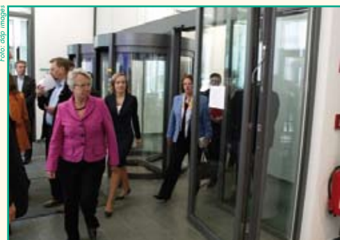
Der Runde Tisch setzt drei Arbeitsgruppen ein